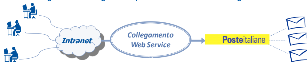
Figura 2- Schema gestione spedizioni di utenti diversi collegati in rete

Il servizio H2H consente la distribuzione della corrispondenza attraverso reti indirette: l'azienda che distribuisce prodotti/servizi affini alla Postaonline, firma un contratto Host to Host con Poste Italiane offrendo così a Clienti terzi la possibilità di inviare Posta Raccomandata pro per l'Italia e Posta Raccomandata Internazionale per l'estero, Posta1pro per l'Italia e Postapriority Internazionale per l'estero, Posta4pro per l'Italia e Postamail Internazionale per l'estero e Telegrammi dal proprio sito o tramite un proprio applicativo. In questo modo, i Clienti terzi non avranno nessun rapporto contrattuale con Poste Italiane e pagheranno le spedizioni o in pay per use o tramite fattura che verrà emessa dall' "Operatore Virtuale di Corrispondenza" cioè il Cliente che ha sottoscritto il contratto con Poste Italiane