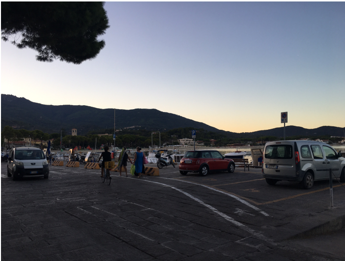
area da illuminare