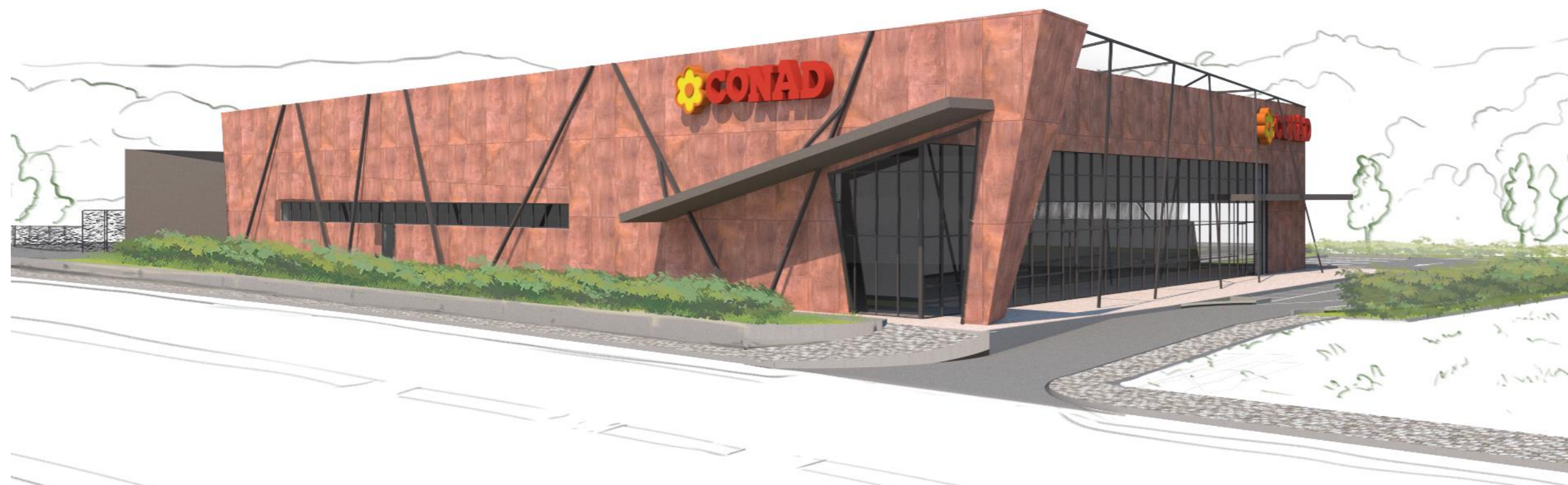
RENDERING LATO SU D OVEST