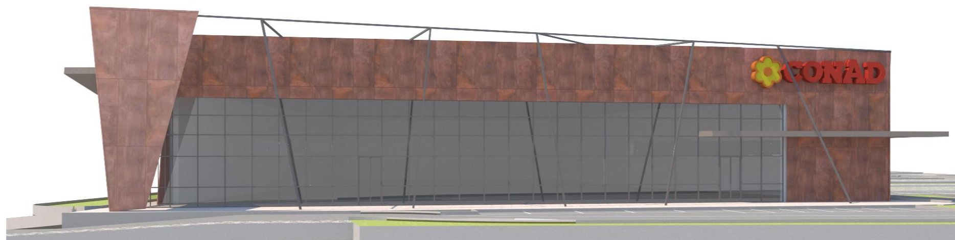
PROSPETTO SUD - RENDERING-1:200