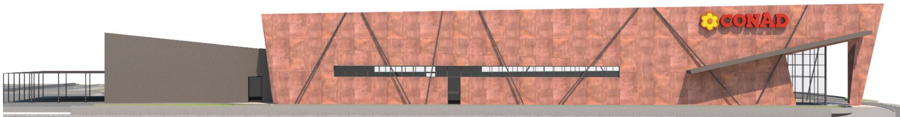
PROSPETTO NORD -RENDERING- 1:200